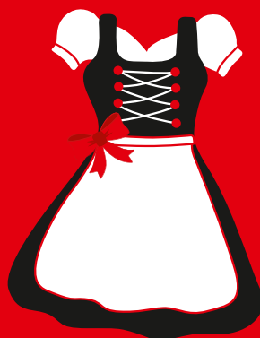
VERGEBEN IN A RELATIONSHIP