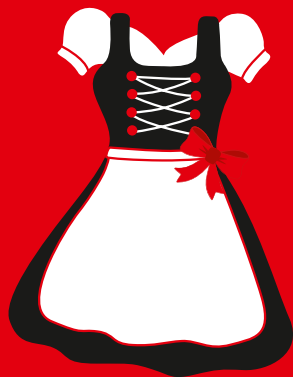
NOCH ZU HABEN SINGLE

Ein neuer Brauch, der sich erst in den letzten Jahren entwickelte, betrifft die Schürzenschleife des Dirndls. Je nach Position der gebundenen Schleife sagt dies etwas über den ehelichen Status der Trägerin aus. Also Augen auf!